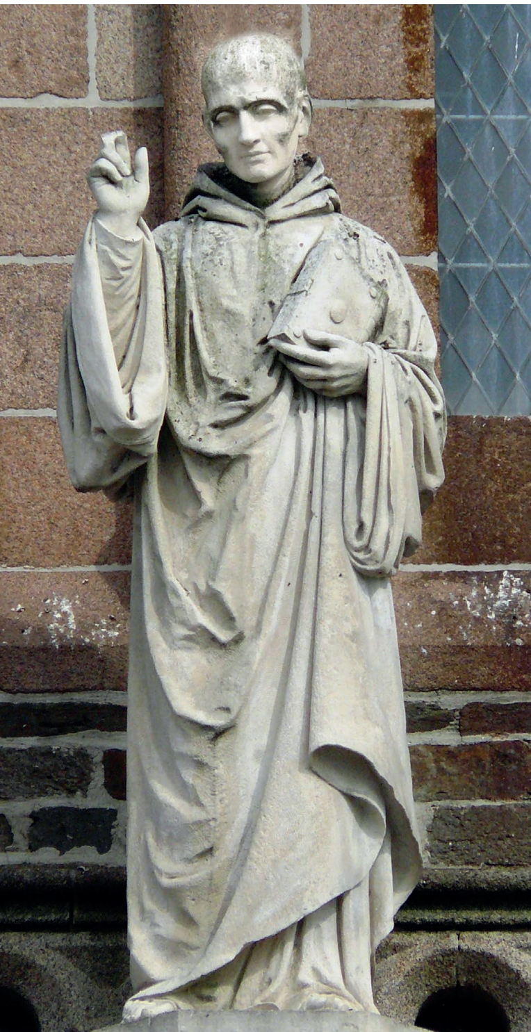
Statue de saint Macaire placée au dessus du grand portail de l'église de Saint-Macaire-en-Mauges.

Il est loin le temps où l'histoire locale et provinciale faisait l'objet d'une question au certificat d'études primaires, un temps que les moins de soixante ans ignorent, celui d'une époque où la majorité des élèves des Mauges recevait un enseignement d'histoire religieuse. Un chapitre de cet enseignement évoquait en quelques paragraphes les débuts du christianisme et « les premiers ermites angevins [...] disciples de saint Martin : saint Vétérian, à Gennes ; saint Maxenceul à Cunault, saint Doucelin, à Allonnes ; saint Macaire au pays des Mauges ; saint Florent au Mont-Glonne » 1 . Et, donc comme il est écrit, saint Macaire pour le pays des Mauges. Que sait-on de ce saint ? Que reste-t-il de lui 1500 ans après son apostolat ?