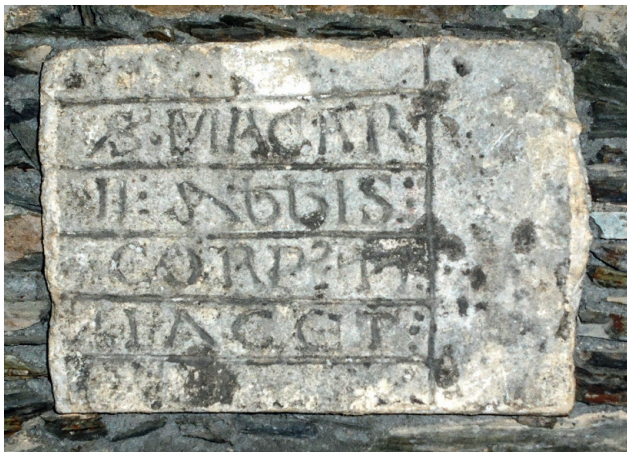
Fragment de la pierre tombale de saint Macaire transférée de Roussay à l'abbaye de Bellefontaine.

la pierre, a prévalu du IV e au VII e siècle. Quant au calcaire coquillier, il fait inmanquablement penser à celui qui était extrait des carrières de Doué-en-Anjou à partir des IV e et V e siècles pour en faire des sarcophages au cours de toute l'époque mérovingienne (481-751).