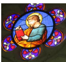
Les rosaces au dessus du vitrail

reconnu guérisseur vers 680, après une épidémie de peste à Rome. Il devient populaire du 14 e au 17 e siècle quand l'Occident chrétien subit le fléau de la mort noire. Il est également protecteur du bétail contre la fièvre aphteuse.