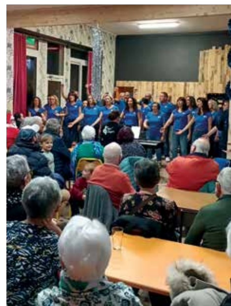
Une chorale se produit au bar de Saint-Crespin.