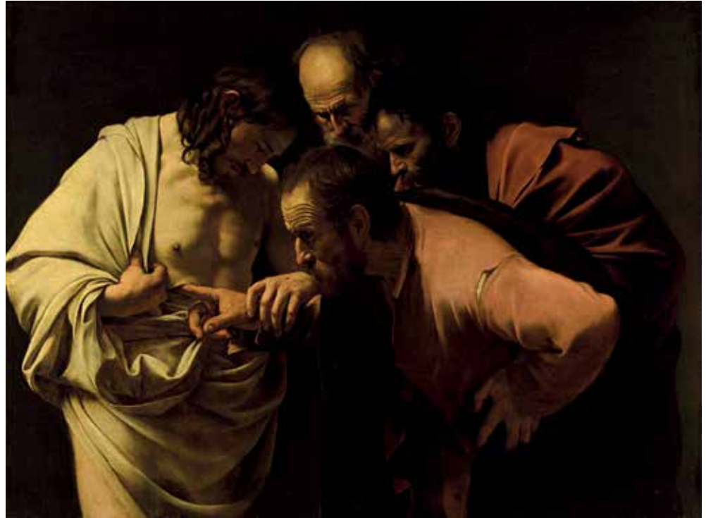
L'Incrédulité de saint Thomas, peinte par Le Caravage.

En résumé, personne ne croit spontanément à la résurrection. On n'entre dans le mystère qu'en tremblant, par l'expérience d'une rencontre. Certains voudraient réduire la chose à une belle image : la résurrection serait comme le printemps après l'hiver, le jour après la nuit. Cela est en partie vrai. La joie, la paix, la guérison sont aussi des signes annonciateurs de résurrection. Ces