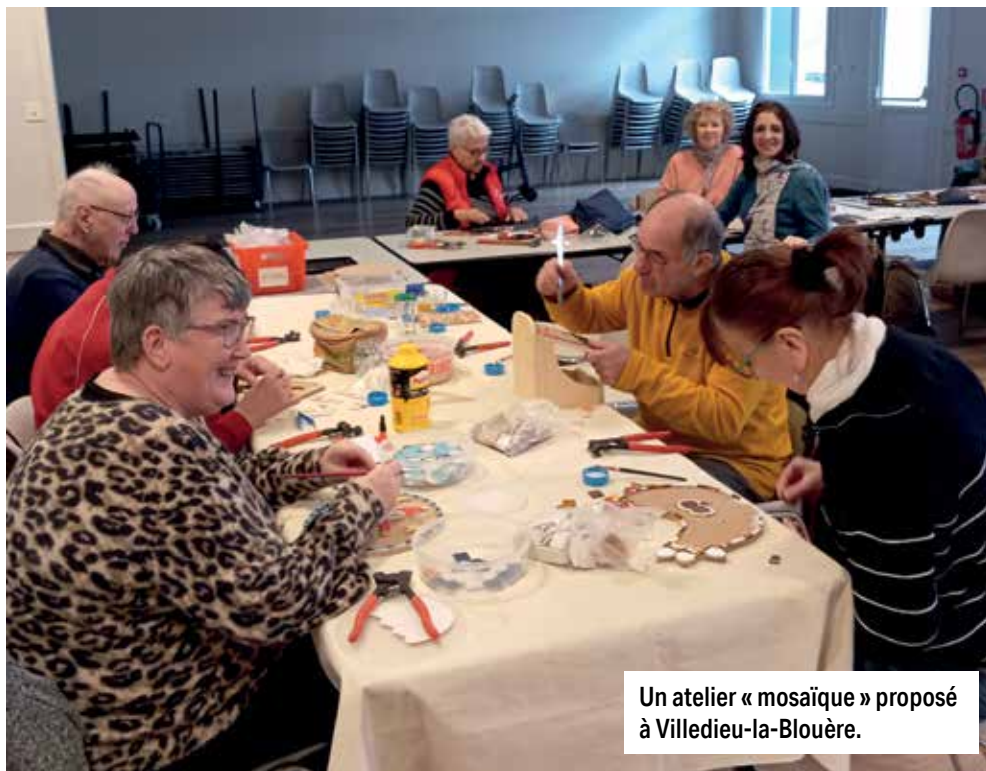
Un atelier « mosaïque » proposé à Villedieu-la-Blouère.

Chaque après-midi se termine par un temps primordial parce que convivial : le goûter pour célébrer l'anniversaire d'un participant ou pour une tout autre raison. Ces moments chaleureux, d'une richesse incomparable, sont toujours fort attendus et savourés à leur juste mesure.